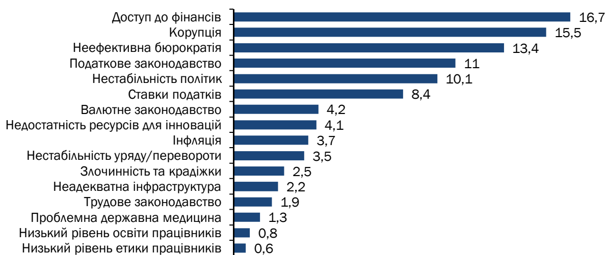
Діаграма 1. Результати опитування щодо основних проблем бізнесу в Україні

(% від опитуваних)